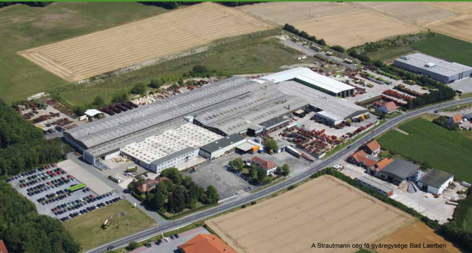
A Strautmann cég fő gyáregysége Bad Laerben

A B. Strautmann & Söhne GmbH u. Co. KG egy máig családi tulajdonban lévő mára már a 4. Generáció irányításával 85 éve folyamatosan kimagasló szakmai elismerésekkel működő vállalat. A Strautmann gépgyár második gyártási helyszíne Lwówek (Lengyelország). A Strautmann cégcsoport Lengyelországi modern gyára készíti az egyedi gépalkatrészeket és a pótkocsik alkatrészeit, valamint kiegészítő berendezéseket, rakodó kanalakat. A Strautmann Gépgyártó Hungaria Kft. Mátranovákon