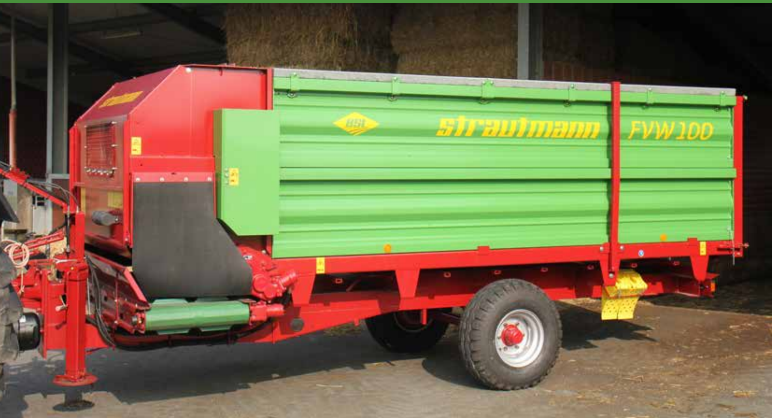
Remorque distributrice de fourrage