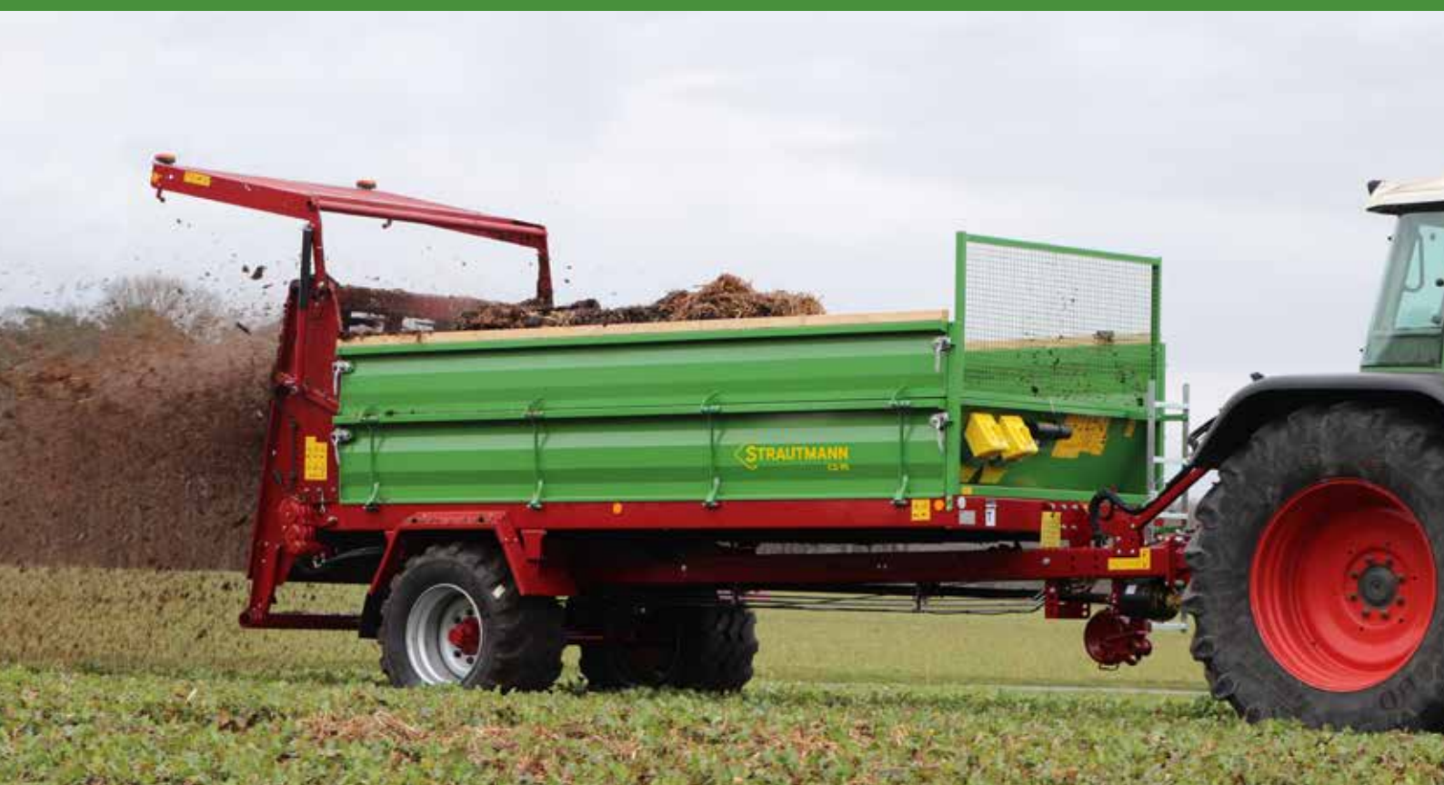
Épandeur à fumier